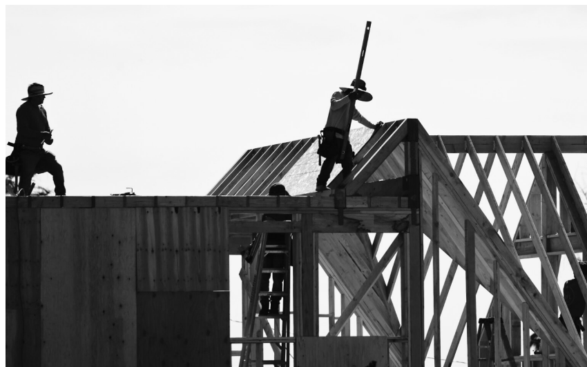
Thợ xây dựng xây nhà ở Altadena, California, hôm 6 Tháng Ba.

Trước đó, cả Dân Biểu Mike Johnson (Cộng Hòa-Louisiana), chủ tịch Hạ Viện, lẫn Thượng Nghị Sĩ John Thune (Cộng Hòa-South Dakota), trưởng Khối Đa Số Thượng Viện, đều